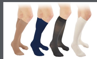
Veinax CHAUSSETTES ET MI-BAS

6 - HAS - Evaluation des dispositifs de compression médicale à usage individuel, utilisation en pathologies vasculaires - Septembre 2010.