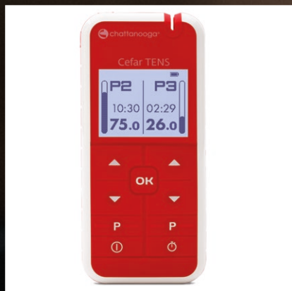
Chattanooga® CEFAR® TENS

Nos dispositifs d'électro-stimulateurs aident à prévenir la TVP en favorisant la circulation sanguine et en diminuant la douleur et l'inflammation post-opératoires.