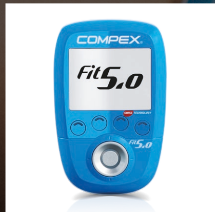
Compex® FIT 5.0

Electrostimateur wireless (sans fil) pour vous aider à prévenir la TVP ou les jambes lourdes partout où vous allez.